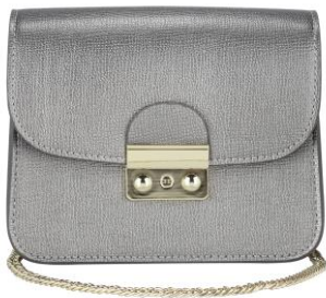
LOOK BY BIPA Crossbody Bag EUR 14,99