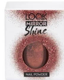
LOOK BY BIPA 030 Mirror Shine Nail Powder Glamorous Red EUR 3,45