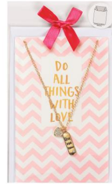
LOOK BY BIPA Grußkarte "Do All Things With Love" EUR 4,99