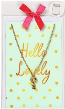
LOOK BY BIPA Grußkarte "Hello Lovely" EUR 4,99