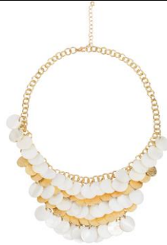
LOOK BY BIPA Kette gold/weiß EUR 14,99