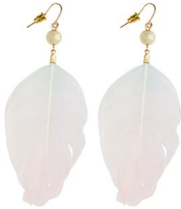
LOOK BY BIPA Ohrschmuck Federn, rosa/türkis EUR 5,99