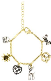
LOOK BY BIPA Armketten EUR 5,95