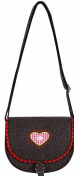
LOOK BY BIPA Tasche rot EUR 8,95