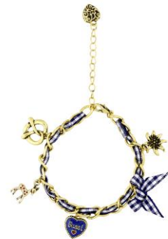
LOOK BY BIPA Armband EUR 5,95