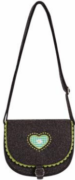
LOOK BY BIPA Tasche grün EUR 8,95