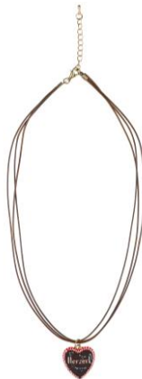
LOOK BY BIPA Kette EUR 4,95