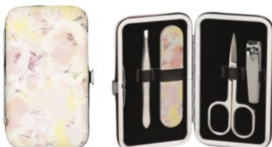
LOOK BY BIPA Manicure Etui, 4-teilig EUR 5,95