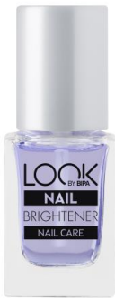
LOOK BY BIPA Nail Brightener EUR 2,25