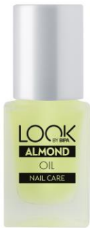
LOOK BY BIPA Almond Nail EUR 2,25