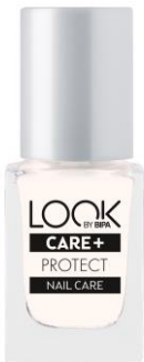
LOOK BY BIPA Care + Protect EUR 2,25