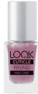
LOOK BY BIPA Cuticle Peeling EUR 2,25