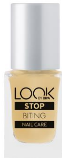
LOOK BY BIPA Stop Biting EUR 2,25