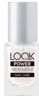
LOOK BY BIPA Power Treatment EUR 2,25