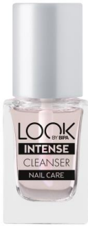
LOOK BY BIPA Intense Nail Cleanser EUR 2,25