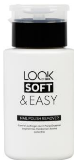
LOOK BY BIPA Soft + Easy Nail Polish Remover EUR 1,95