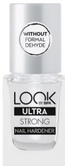
LOOK BY BIPA Ultra Strong Nail Hardener ohne F. EUR 2,25