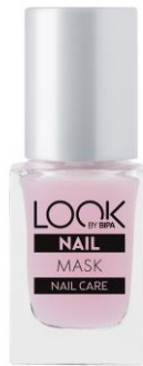
LOOK BY BIPA Nail Mask EUR 2,25