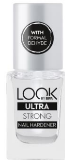
LOOK BY BIPA Ultra Strong Nail Hardener m. F. EUR 2,25