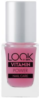
LOOK BY BIPA Vitamin Power EUR 2,25