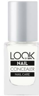
LOOK BY BIPA Nail Concealer EUR 2,25