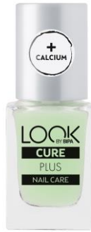
LOOK BY BIPA Cure Plus EUR 2,25