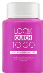
LOOK BY BIPA Quick To Go Nail Polish Remover EUR 2,95