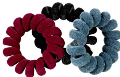
LOOK BY BIPA Spiralzopfummis EUR 3,95