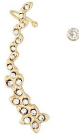
LOOK BY BIPA Ear Cuffs EUR 6,95