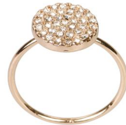
LOOK BY BIPA Ring EUR 4,95