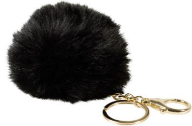
LOOK BY BIPA Schlüsselanhänger EUR 4,95