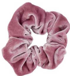
LOOK BY BIPA Haargummi EUR 4,95