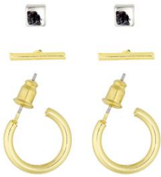
LOOK BY BIPA Ohrstecker 3er Set EUR 5,95