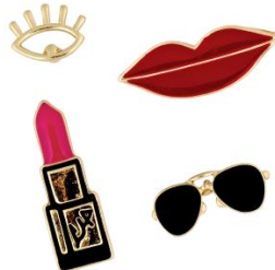
LOOK BY BIPA Buttons EUR 5,95