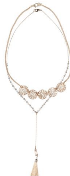
LOOK BY BIPA Kette EUR 8,95