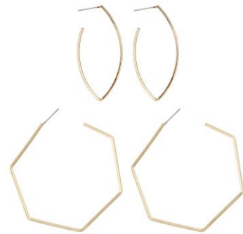
LOOK BY BIPA Creolen 2er Set EUR 5,95