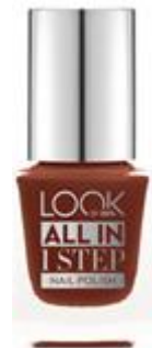
LOOK BY BIPA All in 1 Step Nail Polish Nr.360 Chocolate Dream EUR 2,45