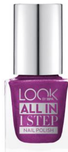
LOOK BY BIPA All in 1 Step Nail Polish Nr.300 Girls Night Out EUR 2,45