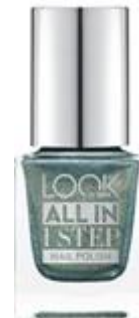
LOOK BY BIPA All in 1 Step Nail Polish Nr.340 Cold As Ice EUR 2,45