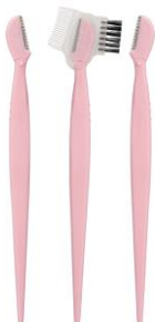
LOOK BY BIPA Augenbrauenrasierer mit Bürste Trend Edition, 3er Set EUR 2,49