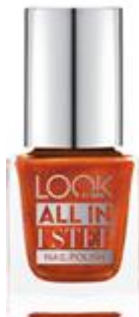
LOOK BY BIPA All in 1 Step Nail Polish Nr.320 Be My Muse EUR 2,45