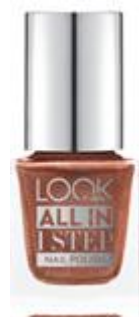
LOOK BY BIPA All in 1 Step Nail Polish Nr.350 Crystallized EUR 2,45