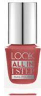
LOOK BY BIPA All in 1 Step Nail Polish Nr.310 Dusty Nude EUR 2,45