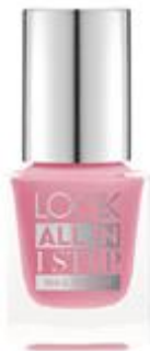
LOOK BY BIPA All in 1 Step Nail Polish Nr.290 Soft and Sweet EUR 2,45