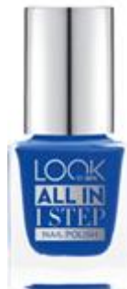
LOOK BY BIPA All in 1 Step Nail Polish Nr.330 Kiss The Sky EUR 2,45