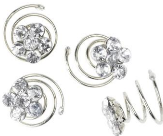
LOOK BY BIPA Haarspirale Strassstein Blume Silber/Clear Preis: EUR 4,99