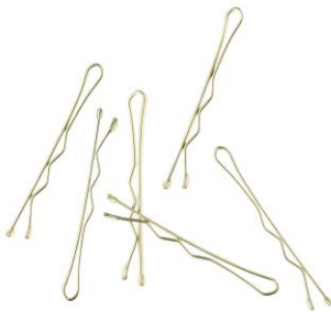
LOOK BY BIPA Haarklemmen 3,2 cm Gewellt, 28 Stück Gold EUR 1,69