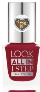
LOOK BY BIPA All In 1 Step Nail Polish Oktoberfest Nr.160 Love It Is EUR 2,25