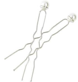
LOOK BY BIPA Haarnadel Perle Silber/Weiß Preis: EUR 3,49