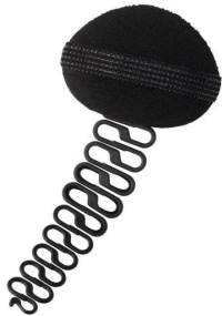
LOOK BY BIPA Flechthilfer mit Dutt-Kissen Schwarz EUR 3,49