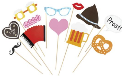
LOOK BY BIPA Selfie Kit EUR 3,99