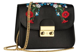
LOOK BY BIPA Cross-Body-Bag Oktoberfest Schwarz EUR 16,99