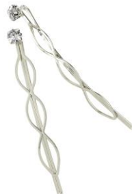
LOOK BY BIPA Haarklemme Strassstein Silber/Clear Preis: EUR 3,99