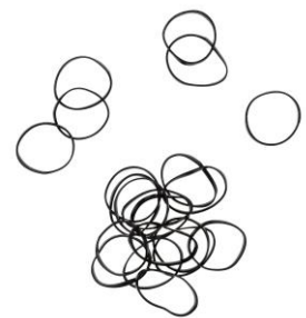
LOOK BY BIPA Zopfhalter Gummi Mini Schwarz EUR 2,49