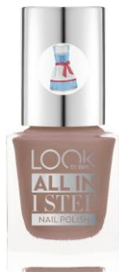
LOOK BY BIPA All In 1 Step Nail Polish Oktoberfest Nr.120 Very Old Rose EUR 2,25