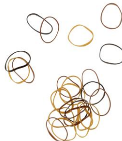
LOOK BY BIPA Zopfhalter Gummi Mini Braunmix EUR 2,49