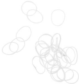
LOOK BY BIPA Zopfhalter Gummi Mini Transparent EUR 2,49