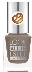
LOOK BY BIPA All In 1 Step Nail Polish Oktoberfest Nr.410 Chillax EUR 2,25