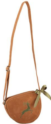
LOOK BY BIPA Filz-Tasche Oktoberfest Grau/Rot EUR 7,99