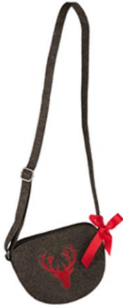
LOOK BY BIPA Filz-Tasche Oktoberfest Braun/Grün EUR 7,99