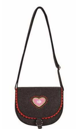
LOOK BY BIPA Trachtentasche „Rot“ EUR 8,99