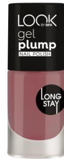
LOOK BY BIPA Gel Plump Nail Polish „Dirndlrosa“ EUR 2,25