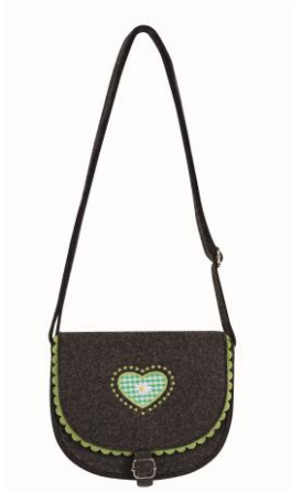
LOOK BY BIPA Trachtentasche „Grün“ EUR 8,99