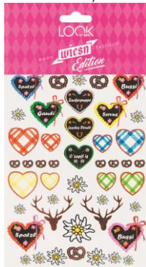
LOOK BY BIPA Wiesn Tattoos Design 1 EUR 3,45