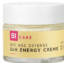
BI CARE Q10 AGE DEFENSE 24h Energy Creme Anspruchsvolle Haut 30+ 50 ml EUR 2,99