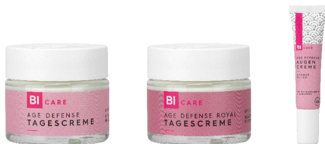
BI CARE AGE DEFENSE Tagescreme Reife Haut 45+ 50 ml EUR 2,99

Wenn die Haut mit der Zeit nach Hilfe ruft, muss man sie beschützen. Am besten mit der BI CARE AGE DEFENSE Tagescreme mit Kalpariane und Vitamin E. Zusätzlich zu diesem Feuchtigkeitsspender schützt die Creme mit LSF 20 vor UV-bedingten Umwelteinflüssen. Anspruchsvolle Haut wird mit der BI CARE AGE DEFENSE ROYAL Tagescreme versorgt. Sie glättet, strafft und festigt reife Haut nachweislich und schützt mit LSF 20 vor lichtbedingter Hautalterung. Für die empfindliche Augenpartie empfiehlt sich die BI CARE AGE DEFENSE Augencreme mit Lipidkomplex aus wertvollen Ölen und Sheabutter. Einfach morgens rund um die vorgereinigte Augenpartie auftragen, leicht einklopfen und strahlen.