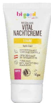
bi good Natürliche Vital Nachtcreme Traube 50 ml EUR 3,99