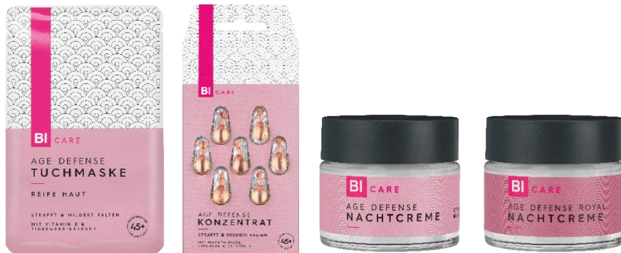
BI CARE AGE DEFENSE Tuchmaske Reife Haut 45+ 1 Stk. EUR 1,79

Zum Grande Finale versorgt die BI CARE AGE DEFENSE Nachtcreme die Haut mit Kalpariane, ein Extrakt aus der Braunalge, und lässt sie glatter wirken. Der Lipidkomplex aus wertvollen Ölen und Sheabutter sorgt dafür, dass die Feuchtigkeit auch in der Haut bleibt und nicht verloren geht. Mit Reforcyl und Passionsblumenöl unterstützt die BI CARE AGE DEFENSE ROYAL Nachtcreme reife Haut gegen die Zeichen der Zeit. Vor allem bei rauerer Haut bewahrt der Lipidkomplex aus Argan- und Passionsblumenöl die Flexibilität und Feuchtigkeit der Haut.