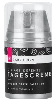
BI CARE MEN Q10 AGE DEFENSE Tagescreme Anspruchsvolle Haut 30+ 50 ml EUR 3,49

Man sagt, Männer dürfen Fältchen haben. Mann sagt: nicht unbedingt! Die BI CARE MEN Q10 AGE DEFENSE Tagescreme pflegt reife Männerhaut. Q10 und Vitamin E schützt Mann vor UV-bedingten Umwelteinflüssen. Mit Feuchtigkeit versorgt der Lipidkomplex aus Jojoba- und Macadamianussöl. Panthenol und Aloe Vera unterstützen die Regeneration und wirken beruhigend nach der Rasur.