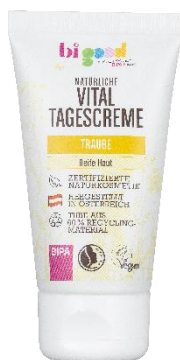
bi good Natürliche Vital Tagescreme Traube 50 ml EUR 3,99

Von früh bis spät führt auch bi good mit zwei idealen Pflegelinien für reife und anspruchsvolle Haut durch den Tag. Bereits am Morgen versorgt die bi good Natürliche Vital Tagescreme Traube die Haut mit wertvollem Traubenkernöl und Reforcyl zur Vorbeugung von Alterserscheinungen. Für den Wow-Effekt rund um die empfindliche Augenpartie sorgt, dank Traubenkernöl und Reforcyl, die bi good Natürliche Vital Augencreme Traube. Die bi good Natürliche Anti-Age Augencreme Schwarze Ribisel mit BIO-Schwarze Ribisel, BIO-Nachtkerzenöl, BIO-Marillenkernöl und Hyaluronsäure pflegt die Haut intensiv und baut sie mit Feuchtigkeit auf. Für die Nachtpflege empfiehlt sich die bi good Natürliche Vital Nachtcreme Traube, die zur Vorbeugung von Fältchen dient und die Haut glättet. Die extra Portion Pflege gibt es mit dem bi good Natürlichem Anti-Age Serum Schwarze Ribisel. Mit BIO-Schwarze Ribisel, Hyaluronsäure und Traubenkernöl fühlt sich die Haut spürbar glatter und straffer an.