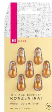
BI CARE Q10 AGE DEFENSE Konzentrat Anspruchsvolle Haut 30+ 7 ml EUR 1,49