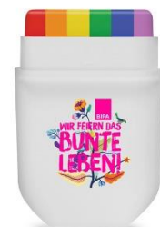
Exklusive BIPA Regenbogen Gesichtskreide EUR 2,00

An diesen heißen Sommertagen dürfen natürlich praktische Eventbegleiter nicht fehlen. Am BIPA-Stand warten die LOOK BY BIPA Pride-Collection, sowie Deos, Sonnencremen, Sonnenbrillen und viele praktische EuroPride-Accessoires auf neue Besitzer.