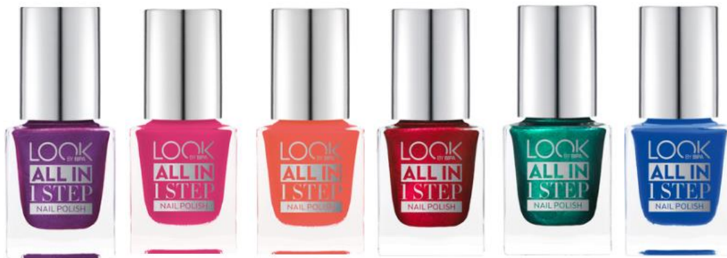
LOOK BY BIPA All in 1 Step Nail Polish Nr. 430 purple fiction EUR 2,25

Für den perfekten All-Over-Look bei der EuroPride sorgen die All in 1 Step Nagellacke in allen Farben des Regenbogens von LOOK BY BIPA. Sie sind die ultimativen Nagellack-Allrounder mit intensiv glänzendem Farbergebnis. Sie trocknen schnell und halten bis zu 7 Tage lang. Mit dem neuen 1-Step-Nagellackkonzept ist es ab sofort nicht mehr nötig einen Base- oder Top-Coat zu verwenden.