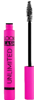
LOOK BY BIPA Lash Unlimited Mascara EUR 2,95

Die Produkte sind ab sofort in allen BIPA Filialen und im BIPA Online Shop erhältlich. Die Gesichtskreide gibt es exklusiv im BIPA Styling-Zelt im EuroPride Village am Rathausplatz.