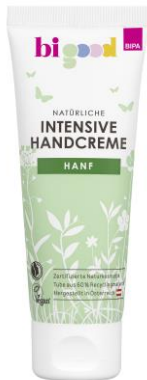
bi good Intensive Handcreme Hanf 100 ml EUR 2,49

Hanf Base Coat. Dieser pflegt nicht nur intensiv mit Hanföl, sondern verleiht den Nägeln auch ein natürliches und gesundes Aussehen.