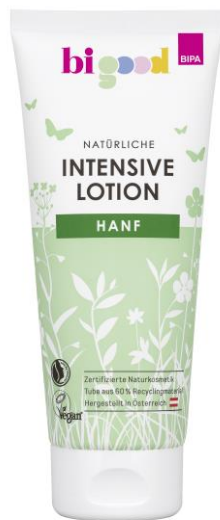
bi good Intensive Lotion Hanf 200 ml EUR 2,79